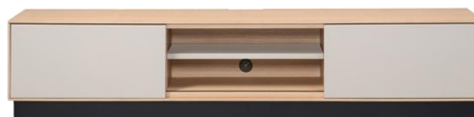
MK TVB KRAD-180