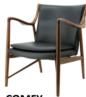
COMFY Lounge chair NOVA