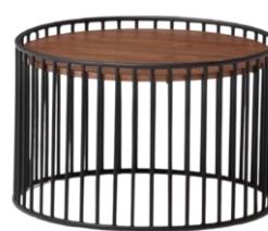
Abita style MYT0738BD